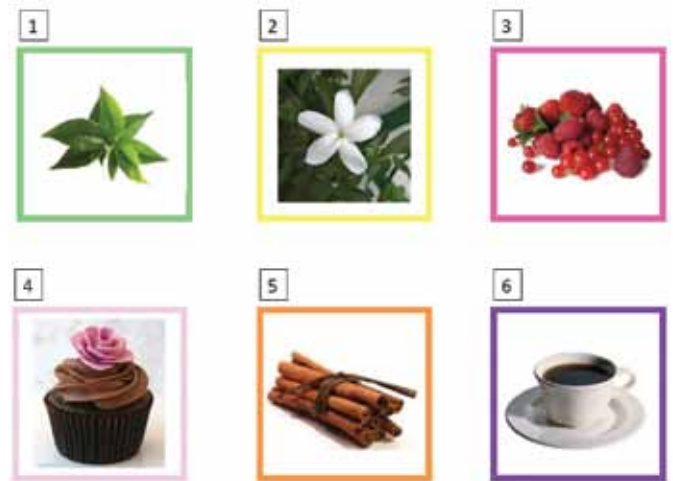
Créé par le Magasin du Monde de l'Externat Sacré-Cœur

Pour faire découvrir la richesse de la gamme de thés vendus dans son Magasin du Monde, l' EXTERNAT SACRÉ-CŒUR a su miser sur un concept déjà bien connu par l'ensemble des Québécois lors de l'achat de leur vin : les pastilles de goût. Les élèves ont développé leur propre grille afin de guider les acheteurs. Futé!